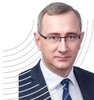
Wladislaw SCHAPSCHA, Gouverneur des Gebiets Kaluga