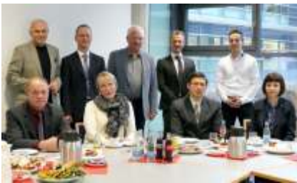
Beim Gespräch in SWE zu Fragen des dualen Hochschulstudiums

So konnte sich im Dezember eine kleine Delegation aus Kiew hier vor Ort ein Bild davon machen, wie die duale Hochschulausbildung abläuft, welche Anforderungen bestehen und wie sie organisiert wird. Es